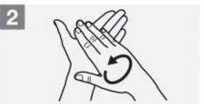
کف دست ها را به هم بمالید

چه موقع دستهایمان را با آب و صابون بشوئیم