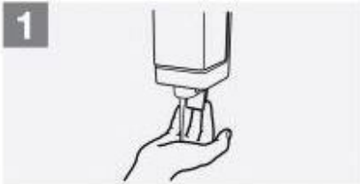
مایع صابون به اندازه کافی روی دست ها ریخته شود